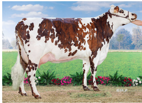
PALMA (Element), mère de UBELDIA - EARL DU BOIS DES SAULES (76) -

» UBELDIA Lombardi x Element (138, AB/A2A3) NEW