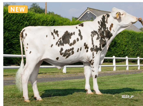
UBIBI AGH (Ravelin)

Issu de la même souche que URUS GH ou encore OSO GH et NESTAR GH pour ne citer qu'eux, le rameau de UBIBI AGH propose un cumul de pointage mamelle mère, gmm et agmm impressionnant avec 8/9 à chaque fois. Ce fils de RAVELIN né à l'Earl de la Bergerie (35) , sera à exploiter pour ses taux (+2.3 TP & +4.1 TB), son format (+1.1), sa remarquable vitesse de traite (+1.6) ou encore ses élémentaires aplombs, tous très positifs . Si vous recherchez de grandes laitières bien conformées et fertiles alors UBIBI AGH est votre taureau. Cerise sur le gâteau il est A2A2 et RPTB vis-à-vis de la paratuberculose.