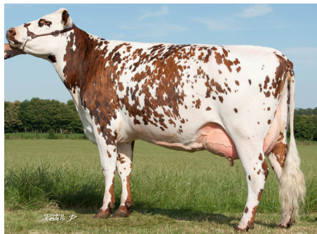
CYDONIE (Royal Holl), Agmm de TARASCONY - EARL DES VENTS (61) -

» TARASCONY Marvel x Navidad (150, AB/A1A2) NEW