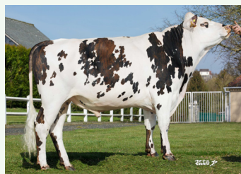
» PASSWORD Mille DT x Folden (157, AB/A2A2)

Né de la copropriété Beaudoux-Guéret-Tessier (28) , il reste stable après la prise en compte de 12 contrôles et 7 classifications.