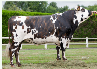
» PELE GH Manchester x Infinity (153, BB/A2A2)

Né dans le calvados dans l'élevage Lebel , PILIER fut l'un des taureaux les plus utilisés de ces dernières campagnes. Lors de cette indexation, il se renforce avec 25 filles contrôlées dont 7 pointées et il gagne 3pts d'ISU