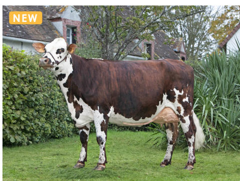
SAMOURAI (Oujoli), mère de URIOS - EARL DEBRAY JEAN PIERRE (28) -