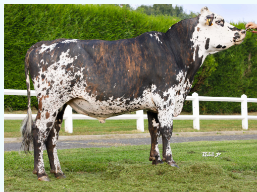
TZEES PC (Paluel)

Porté par de généreux taux (+1.7 TP & +4.0 TB), des fonctionnels adaptés (+1.0 RD, +1.1 STMA, +1.9 LGF et +2.0 Sfer) et un linéaire morphologie adapté à toutes les demandes . Pour mémoire, il puise ses origines dans la souche JESSE PC du Gaec Perche Cotentin (61). Pour finir, il affiche des gènes d'intérêt sans faille (BB, A2A2, non porteur BLIND) et un statut paratuberculose le plus intéressant « RPTB » . Après un très bon démarrage en semence conventionnelle, il sera maintenant possible d'en disposer en semence sexée femelle .