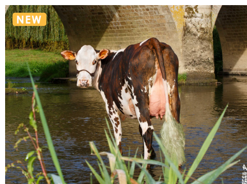
RENNES (Oujoli), mère de UTAZAY - GAEC DE LA NORMANDE (53) -

Ce fils de la toute première fille de OUIJOLI née au Gaec de la Normande (53) propose un profil valeur ajoutée renforcé par de très bons fonctionnels et des élémentaires morphologiques recherchés . Ce jeune taureau sera idéal pour travailler la conformation avec de belles largeurs devant (+0.4 LP) comme derrière (+0.9 IS) et il ramènera de la côte (+0.6 PP). Au vu de ces index liés au format, ce taureau sera donc à préconiser sur des vaches , et les veaux auront une belle vitalité pour garantir un démarrage optimal. Ce taureau à « type » sera également un bel atout pour gagner des points de matière utile avec du TP (+1.4), du TB (+3.0) mais aussi de la qualité (+1.9 en Cellules / +1.0 en mammites cliniques). UTAZAY sera donc parfait pour les systèmes basés sur le pâturage ou la valorisation de la qualité du lait est bien présente.