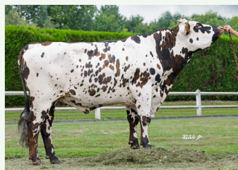
» PACO BGT Montfort x Jolfover (173, BB/A2A2)

Nous restons en veille sur les taureaux suivants :