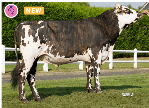
URUS AGH (Picasso)

► URUS AGH Picasso x Gaiac (181, BB/A1A2)